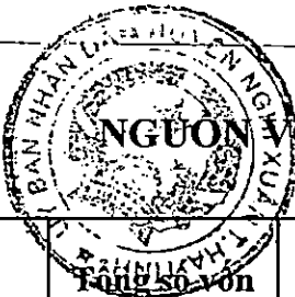
Biểu số 10